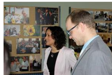
Výstava společnosti KreBul, ale i SeniorPointu na krajském úřadu v Českých Budějovicích