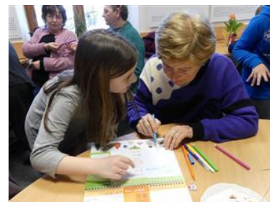
Mezigenerační setkání, SETKÁNÍ STOLETÝCH, či blížících se stovce