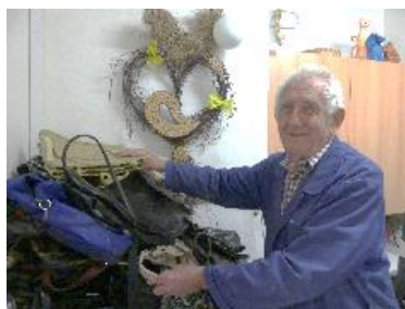
Senioři se zapjili do Kabelkového veletrhu

sbírky a pomohli 210 000,- Kč talentovaným dětem.