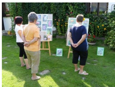
nabídla svoji zahradu k posezení, popovídání, sdílení.