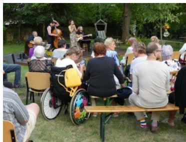
SeniorPoint podpořil benefici Chelčického domova sv. Linharta.