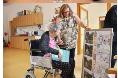
SeniorPexeso v Písku a Vodňanech.