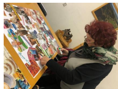
SENIORŮ V OBRAZE