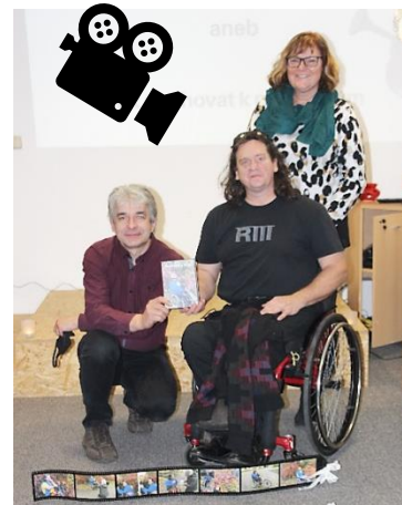
POČÍTÁME S VÁMI, DVD