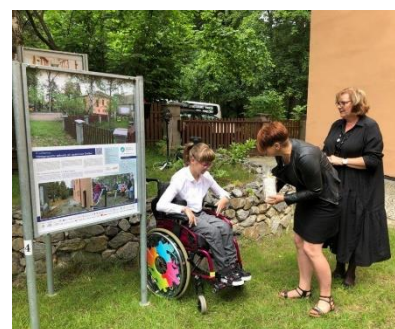
VÝSTAVA MÁ VLAST V ZAHRADĚ, SETKÁNÍ