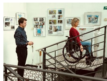
Zahájení provozu plošiny do komunitního centra