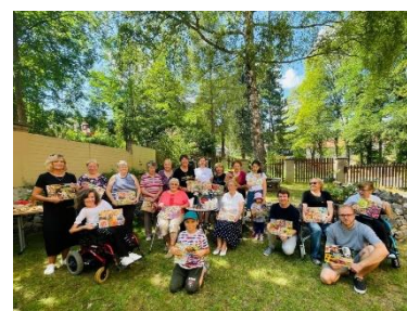
Piknik proti samotě – nikdo nebyl sám