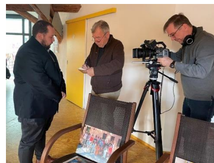
Natáčení v KC Na půdě o mezigeneračních vztazích