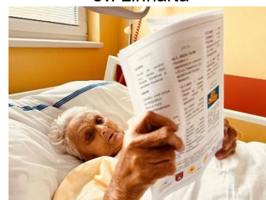
PRESS i do nemocnice se nes