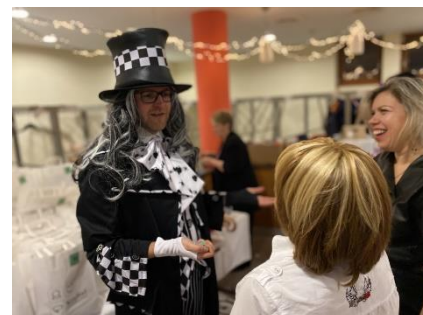
Maškarní bál, který nám hodně vydělal