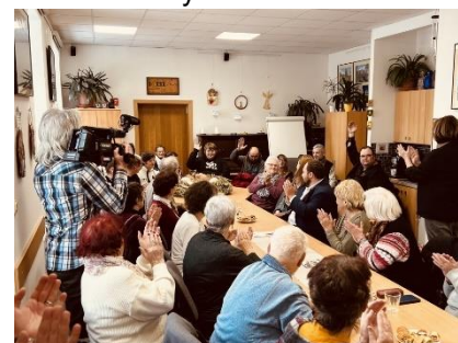
Kachle a obrazy – výstava klientů z Chelčického domova sv. Linharta